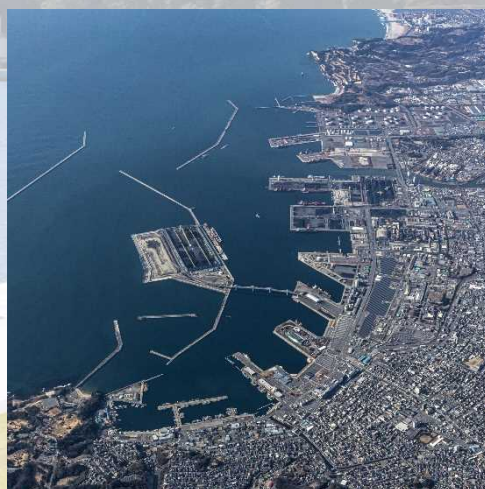
写真(左上)石巻南浜津波復興祈念公園・(右上)国道13号泉田道路(新庄鮭川～新庄真室川間)・(左下)石巻かわまちづくり・(右下)小名浜港全景