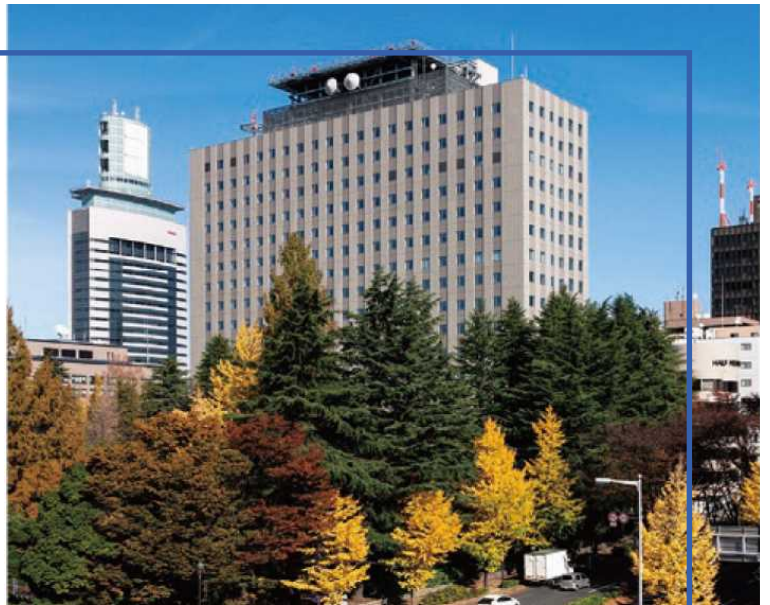
▲東北地方整備局(仙台合同庁舎B棟)