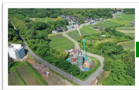
▲日本海沿岸東北自動車道(遊佐象潟道路)

秋田港湾事務所 ▶休憩 ▶子吉川(二十六木地区河道掘削) ▶日本海沿岸東北自動車道(遊佐象潟道路)