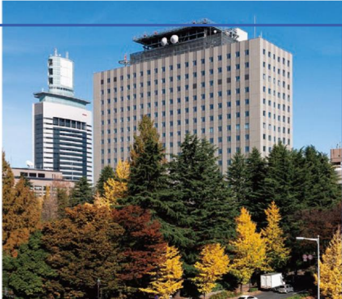
▲東北地方整備局(仙台合同庁舎B棟)